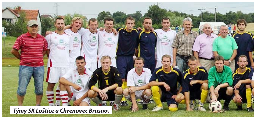
Týmy SK Loštice a Chrenovec Brusno.