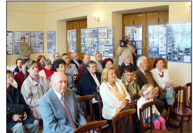
Výstava Vysoké Tatry v Kulturním domě v Lošticích.