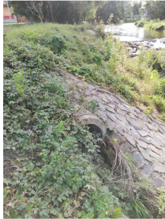
Vyústění stoky H