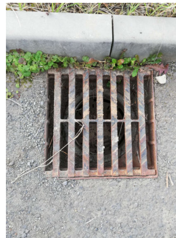
Vpust' ATERNUS 500x500 – Na Pešti