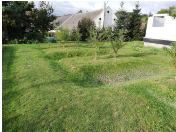
Vsaky – Na Pešti