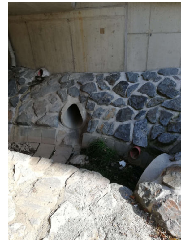
Vyústění stok K, L1 a M pod mostem