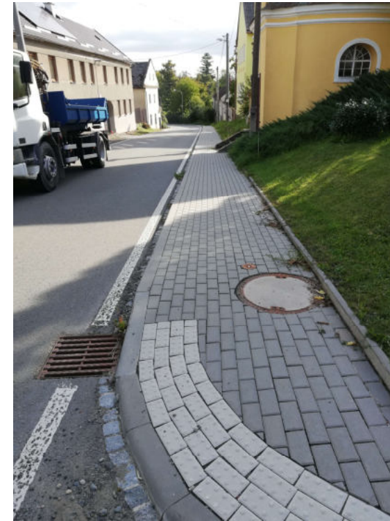
Začátek stoky U – Žádlovice