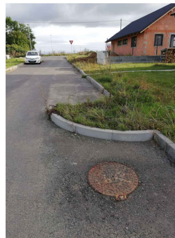
Kanalizační poklopy PAM – Na Pešti