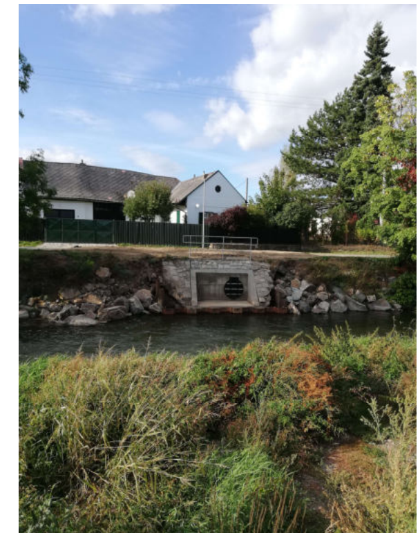
odlehčovací komora na stoce A