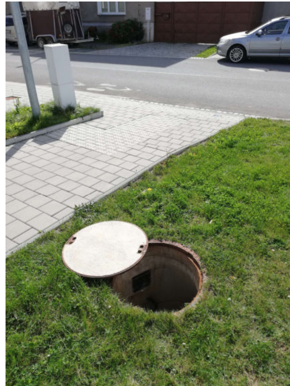
Šachta č.458 – stoka H2