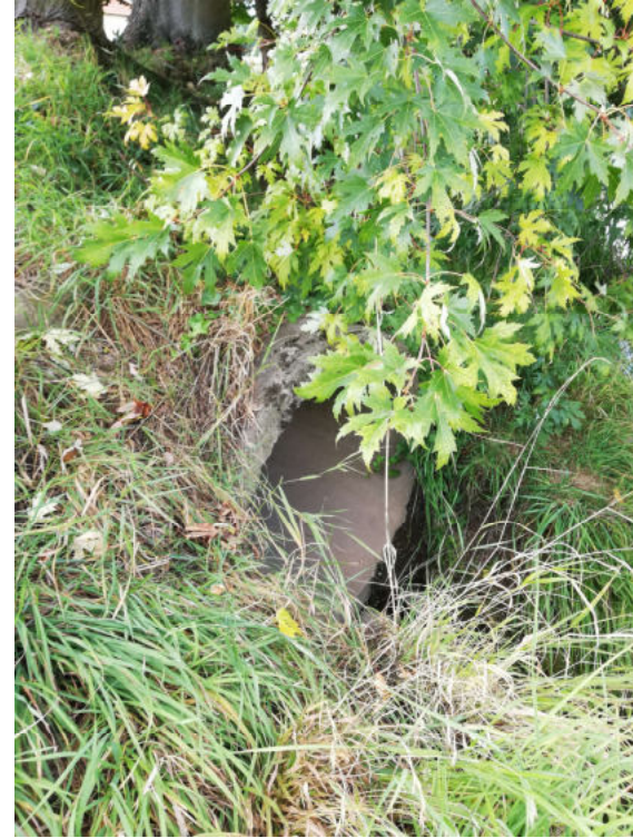
Vyústění stoky L