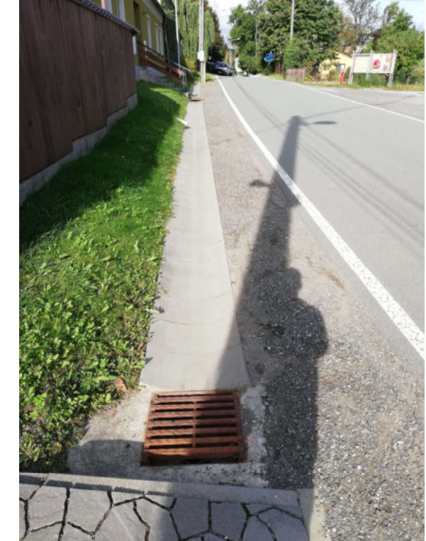
zatrubnění + bet žlab – Žádlovice