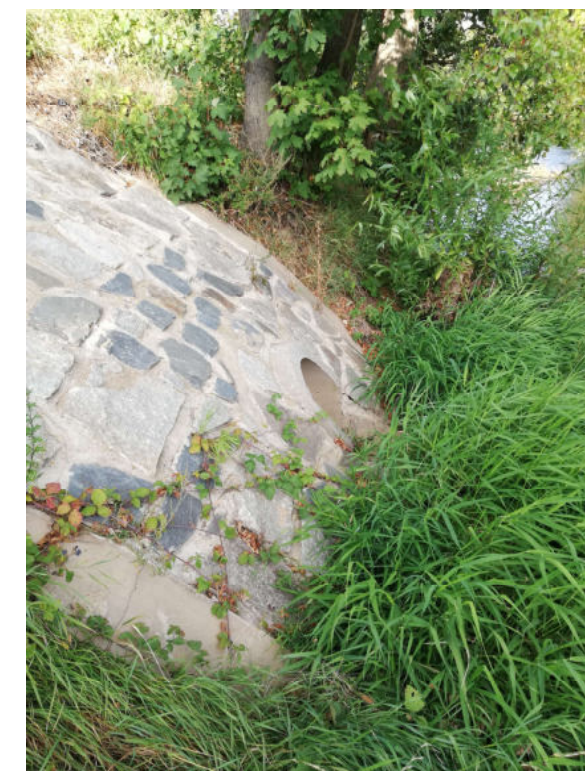
Vyústění stoky F