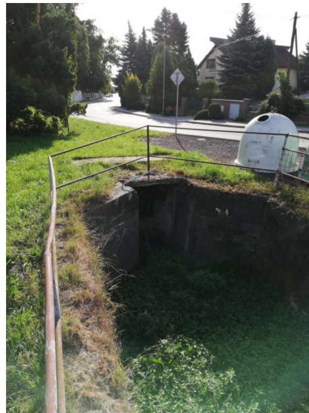
Vyústění a nátok zatrubnění potoka – Žádlovice