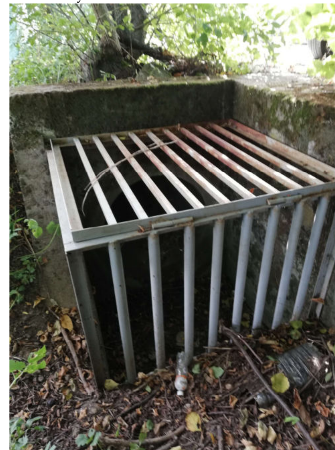
Nátok stoky C